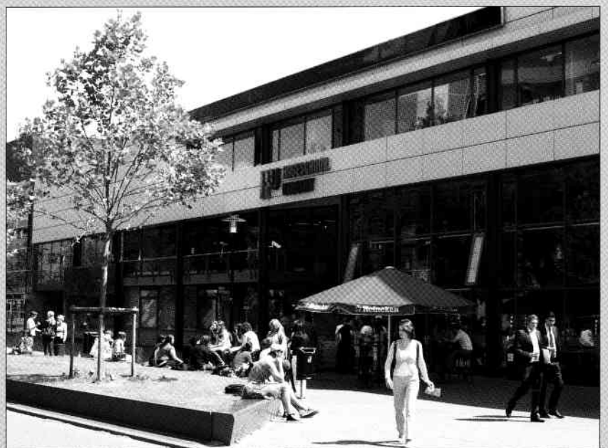
Ingang School voor Journalistiek (onderdeel Hogeschool Utrecht) aan de Padualaan in 2009.

Inhoudelijk wordt de vernieuwing van het onderwijs sinds tien jaar ondersteund door een lectoraat binnen de faculteit, waarin docenten in hun vakgebied onderzoek kunnen doen. Dat leidde tot publicaties over onder meer social media, storytelling, journalistiek en politiek, infographics en journalistieke businessmodellen. Drie docenten promoveerden op hun onderzoek.