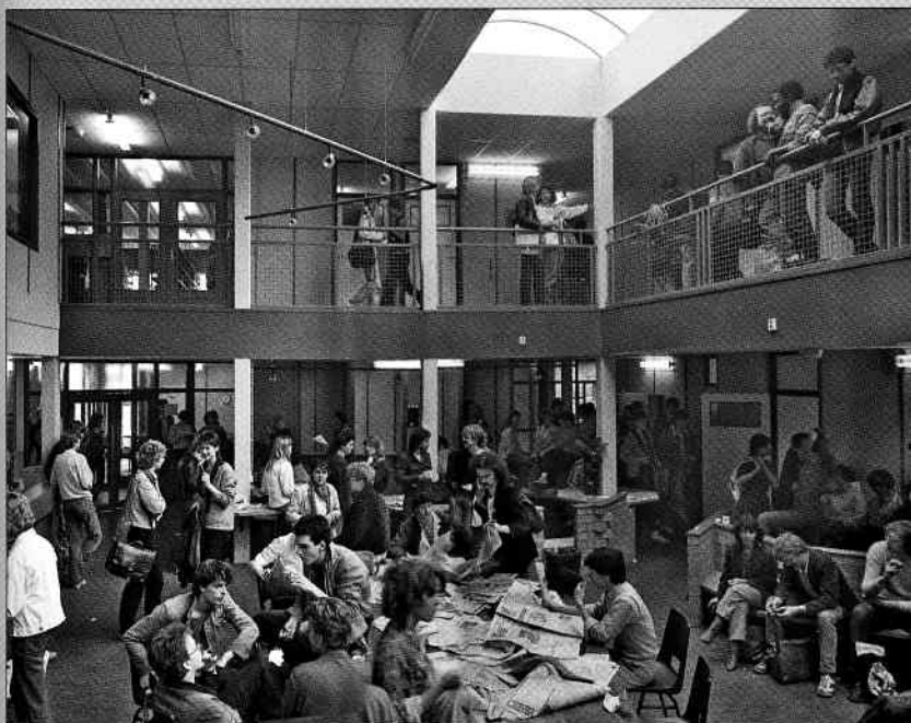
De 'vide' in het gebouw aan de Ravellaan in de jaren tachtig.