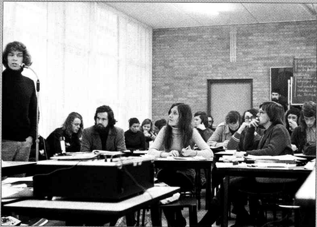
Algemene School Vergadering (ASV) in 1970.