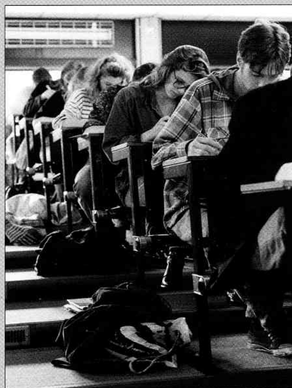
College eerstejaars aan de Ravellaan in 1992.